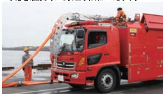
●300Aホース回収装置車両搭載イメージ

車両前方からホースを回収するため、運転員がホースの状態を確認しながら安全な作業ができます。