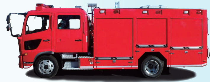
長時間放水・水受困難地区に活躍