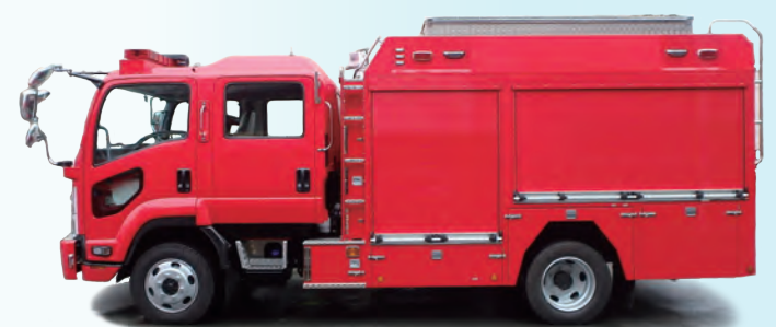
ホースカーを搭載、長距離送水向け