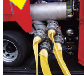
▲水中ポンプ接続口