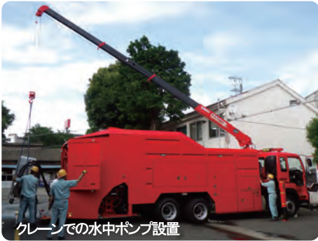
クレーンでの水中ポンプ設置