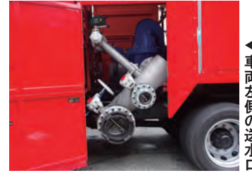
▲車両左側の送水口

車両側面の下方に水中ポンプ接続口と送水口が付いています。低位置に接続口があるのでホースの着脱が容易にできます。