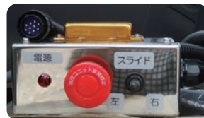
▲スライドリモコン